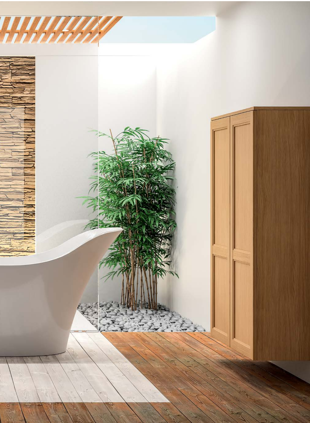
Modèle LINXIA-ROMANS Une laque mate, un bois de chêne et la nature s'invite pour magnifier ce moment de détente.